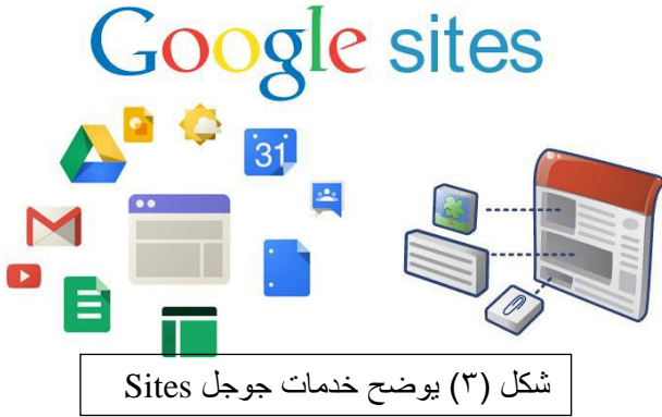
شكل (٣) يوضح خدمات جوجل Sites

اعتمد الباحث على خدمة جوجل للمواقع في تصميم صفحات الويب التعليمية في الدراسة الحالية.