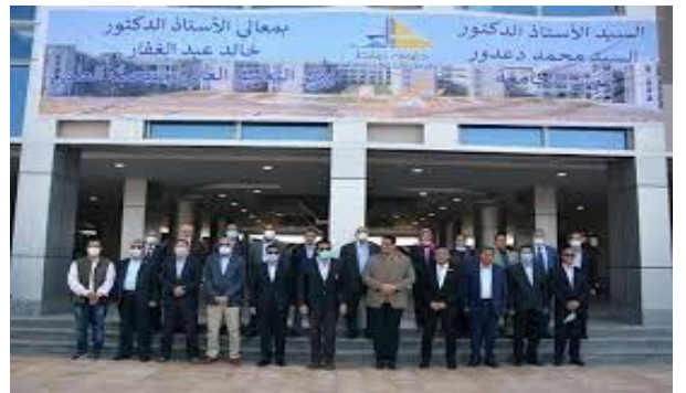
بعض الصور لموقع جامعة دمياط وبنيتها التحتية