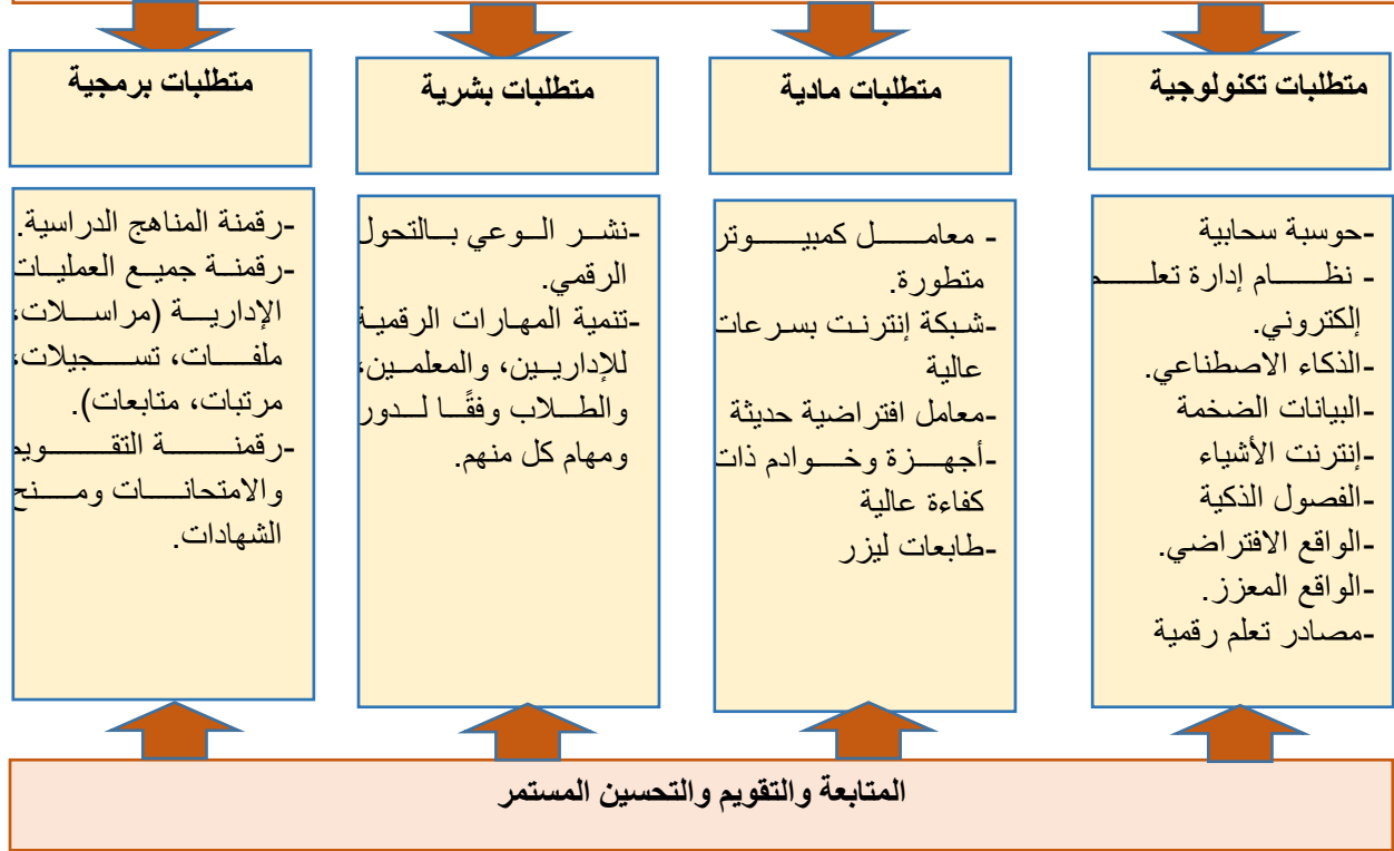
شكل (٢) النموذج المقترح لمتطلبات التحول الرقمي في المؤسسات التعليمية

التخطيط الاستراتيجي للتحول الرقمي في المؤسسات التعليمية: الرؤية، والرسالة، والقيم، تحليل SWAT، الأهداف الاستراتيجية، استراتيجيات وخطط العمل، إعداد الخطط، النتائج والإنجازات.